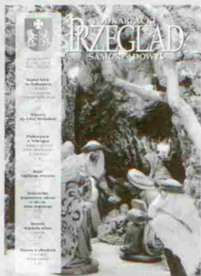
Okladka: Szopka neapolitańska z Muzeum Towarzystwa Jezusowego w Starej Wsi