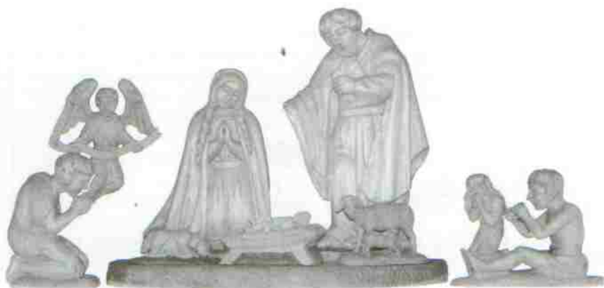
Szopki z Muzeum Towarzystwa Jezusowego Prowincji Polski Południowej w Starej Wsi koło Brzozowa.